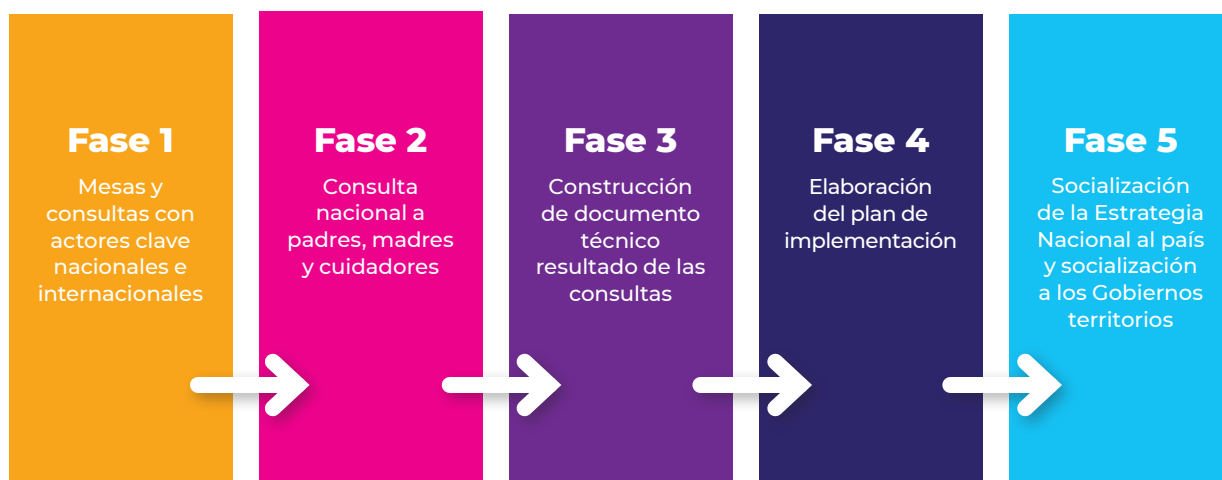
Figura 2. Fases de formulación de la Estrategia Nacional Pedagógica y de prevención del castigo físico, tratos crueles, humillantes o degradantes