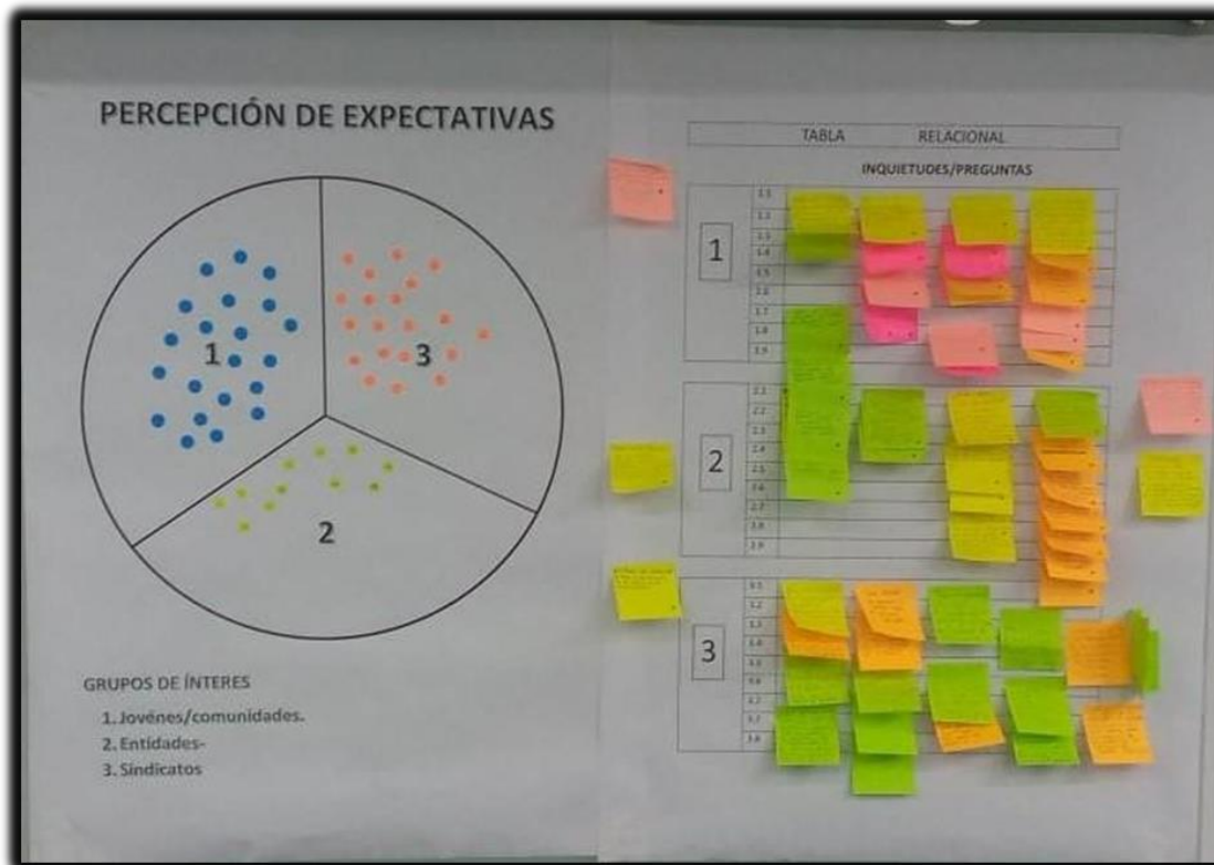
Gráfica 1. Mapeo participativo