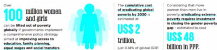
La crisis del COVID-19 ha retrasado el avance hacia la igualdad de género.