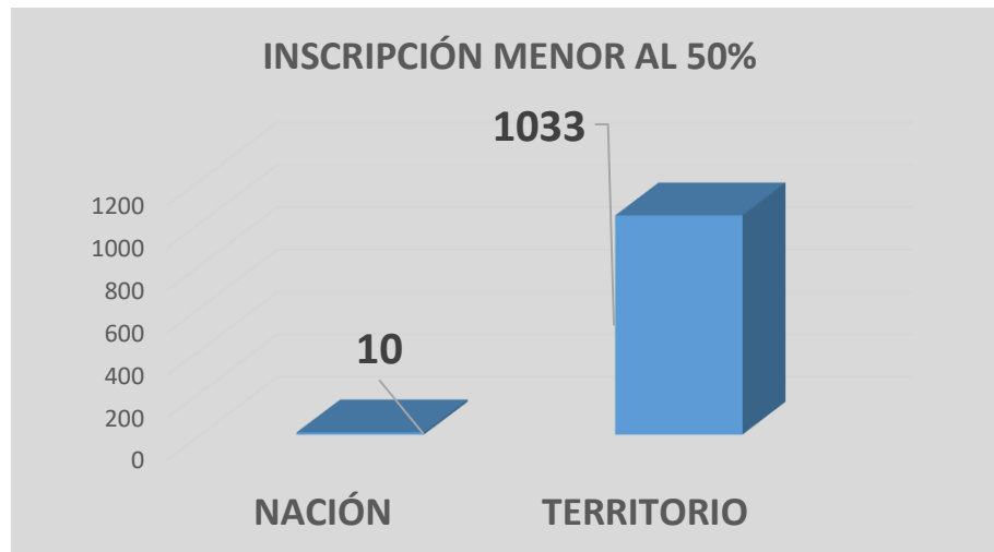
Ilustración 1. Entidades con porcentaje de inscripción de trámites en el SUIIT inferior al 50% para la vigencia 2023