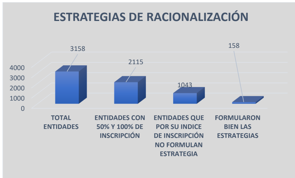
Ilustración 3. Entidades con porcentaje de cumplimiento de estrategias de racionalización inferior al 50% para la vigencia 2023