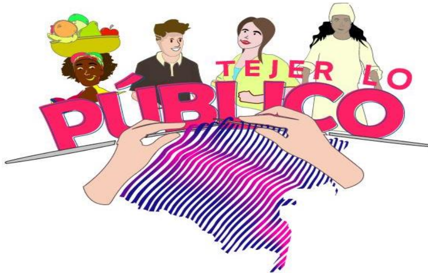
Figura 1. Tejer lo público

De esta manera, “ Tejer lo Público ” nos convoca como Estado a la creación de una verdadera soberanía popular, a la renovación de la actividad política y la integración de grupos sociales tradicionalmente segregados o expulsados de la vida pública.