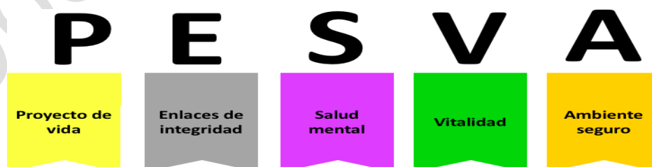
Gráfica 2: Formulación del Programa

Acorde con los resultados relacionados anteriormente y definiendo las áreas que se interrelacionan entre los procesos de Bienestar Social, Capacitación y Seguridad y Salud en el Trabajo; se definen los siguientes ejes de intervención cuyas iniciales dan el nombre al programa: