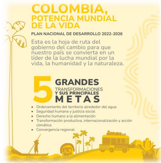
Ilustración 2. Transformaciones del PND “Colombia Potencia Mundial de la Vida”.

Los propósitos de gobierno y el resultado de los diálogos sociales vinculantes adelantados en todo el país, se organizaron en el PND “Colombia Potencia Mundial de la Vida” (2022-2026) alrededor de cinco (5) transformaciones, 8 actores claves y 3 objetivos para la estabilidad macroeconómica.