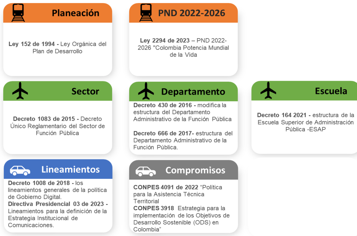
Ilustración 1. Marco normativo para el PES

Las normas en mención se tuvieron en cuenta para la construcción del plan estratégico sectorial, tal como se muestra en los diferentes apartados del documento y en la matriz operativa.