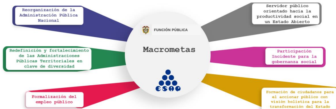
Ilustración 7. Macrometas sectoriales.

Departamento Administrativo de la Función Pública -DAFP- contribuyen al posicionamiento del sector y a alcanzar las transformaciones propuestas, así: