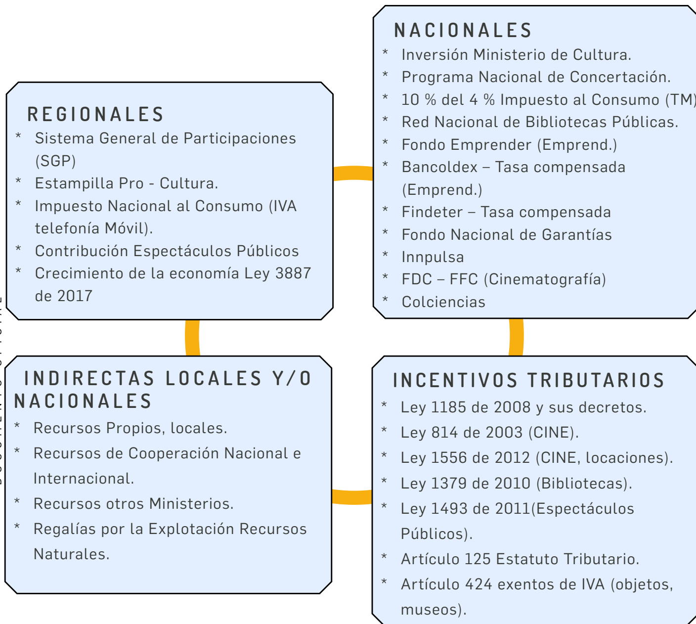
Ilustración 1. Fuentes de financiación para la cultura