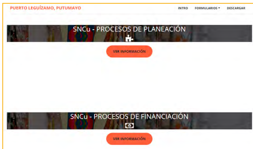
Ilustración 6. Ingreso a los formularios procesos de planeación y financiación en SIFO (sistema de información de fomento regional)