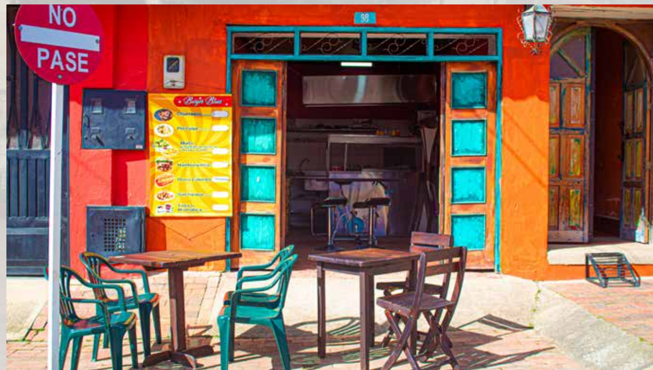
Burger Blues - Los caminantes