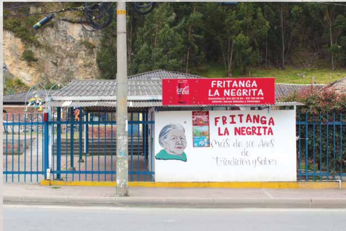
Fritanga La Negrita Antigua plaza de mercado Horarios de atención: Jueves, Sabado y Domingos 12:00 m - 09:00 pm