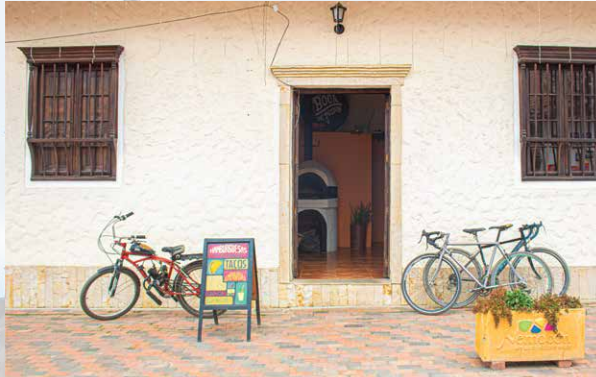
Restaurante En Boca de Todos calle 4 # 5 centro Horarios de atención: martes a domingo 12:00 m - 09:00 pm