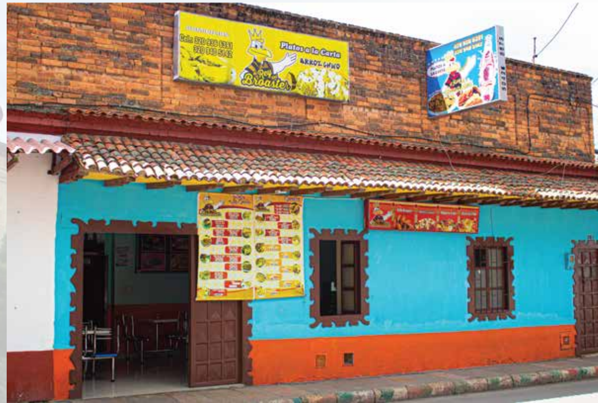
Asadero El Rey del Broaster Calle 3 # 05-80 Horarios de atención: domingo a domingo