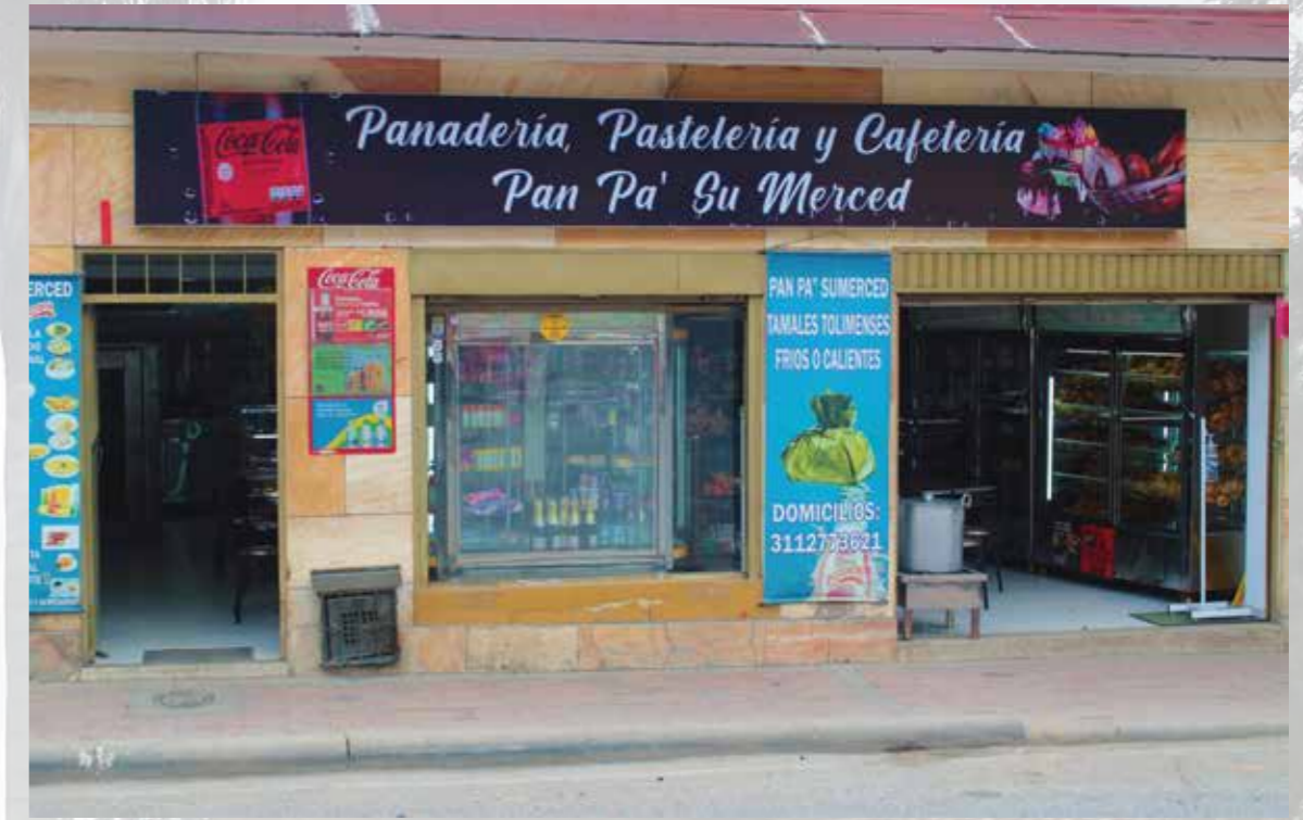
Panaderia y pasteleria pan pa'sumerce Carrera 06 # 01-10