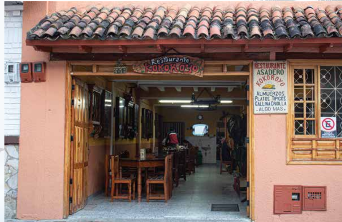
Restaurante Kokoroyo calle 4 # 5-21 Horarios de atención: todos los días 06:00 am - 09:00 pm