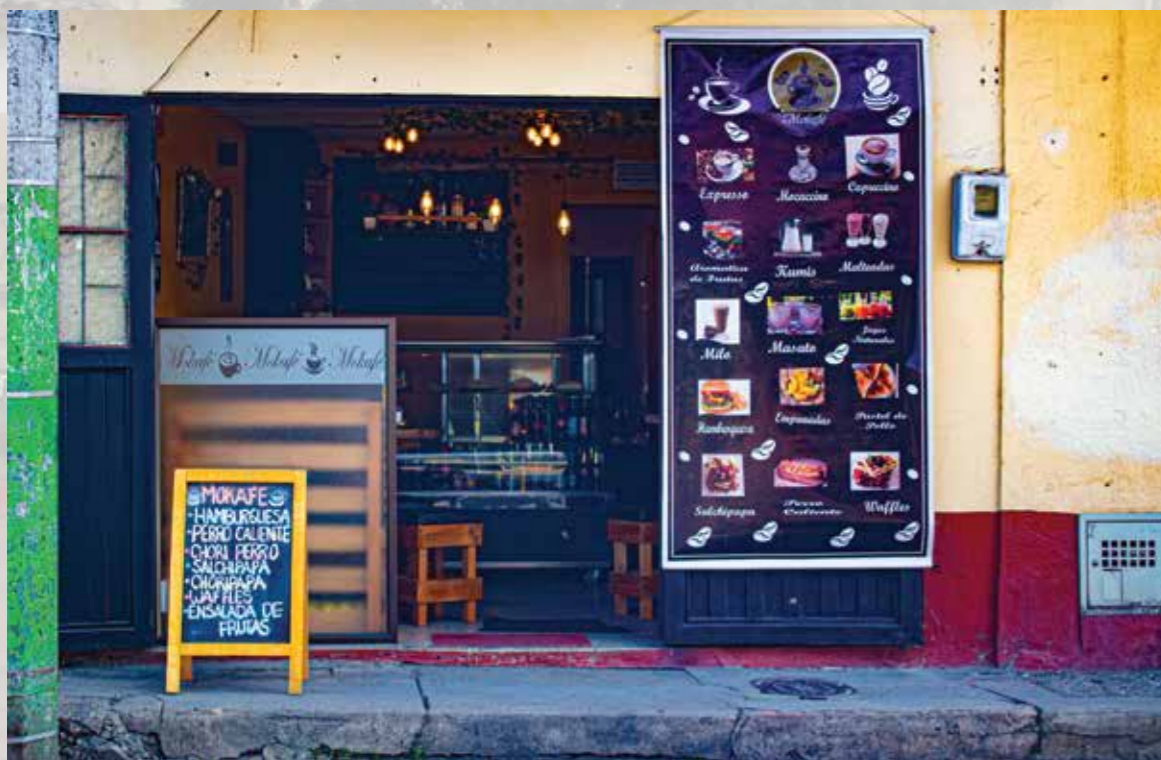
Cafeteria Mokafe Diagonal 02 # 05