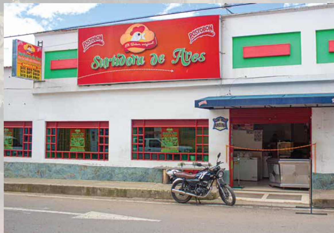
Asadero Surtidora de Aves Calle 02 # 04 -16 Horarios de atención: domingo a domingo