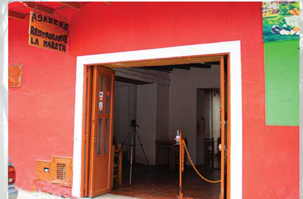
Restaurante y asadero La Marota calle 2a # 05-31

Horarios de atención: sabados, domingos y festivos 08: 00 am - 06:00 pm