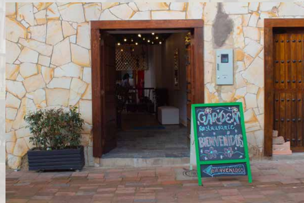
Restaurante Garden calle 04 # 05-29