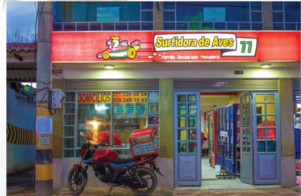
Asadero Surtidora de Aves la 77 Cra 6 # 02-73 Horarios de atención: domingo a domingo