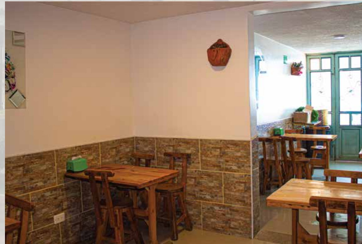
Restaurante La Esquina del Sabor calle 02 # 04-04 Horarios de atención: todos los días 07:00 am - 04:00 pm