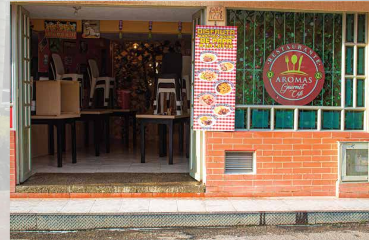
Restaurante Aromas Gourmet calle 02 # 02-78 Horarios de atención: todos los días