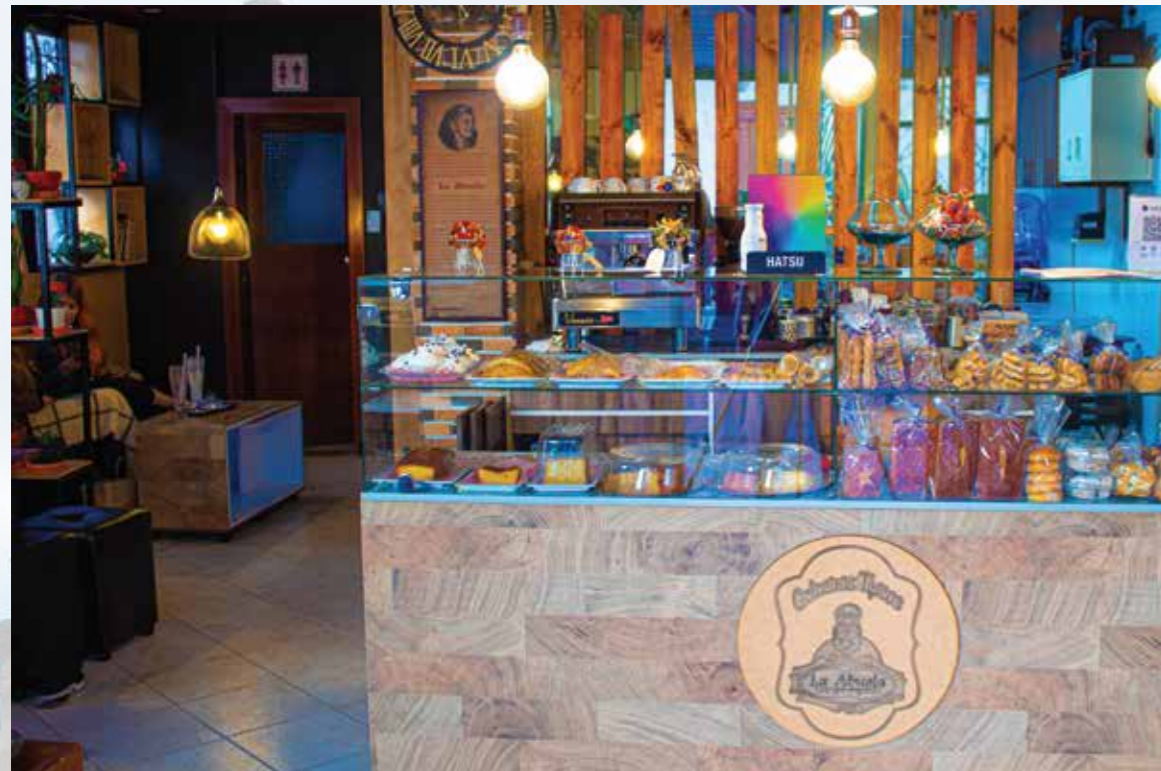
Golosinas Típicas de la Abuela Calle 03 # 05-80