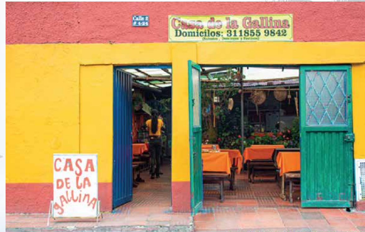
La Casa de la Gallina calle 2a # 04-24 Horarios de atención: sabados, domingos y festivos 12:00 m - 06:00 pm