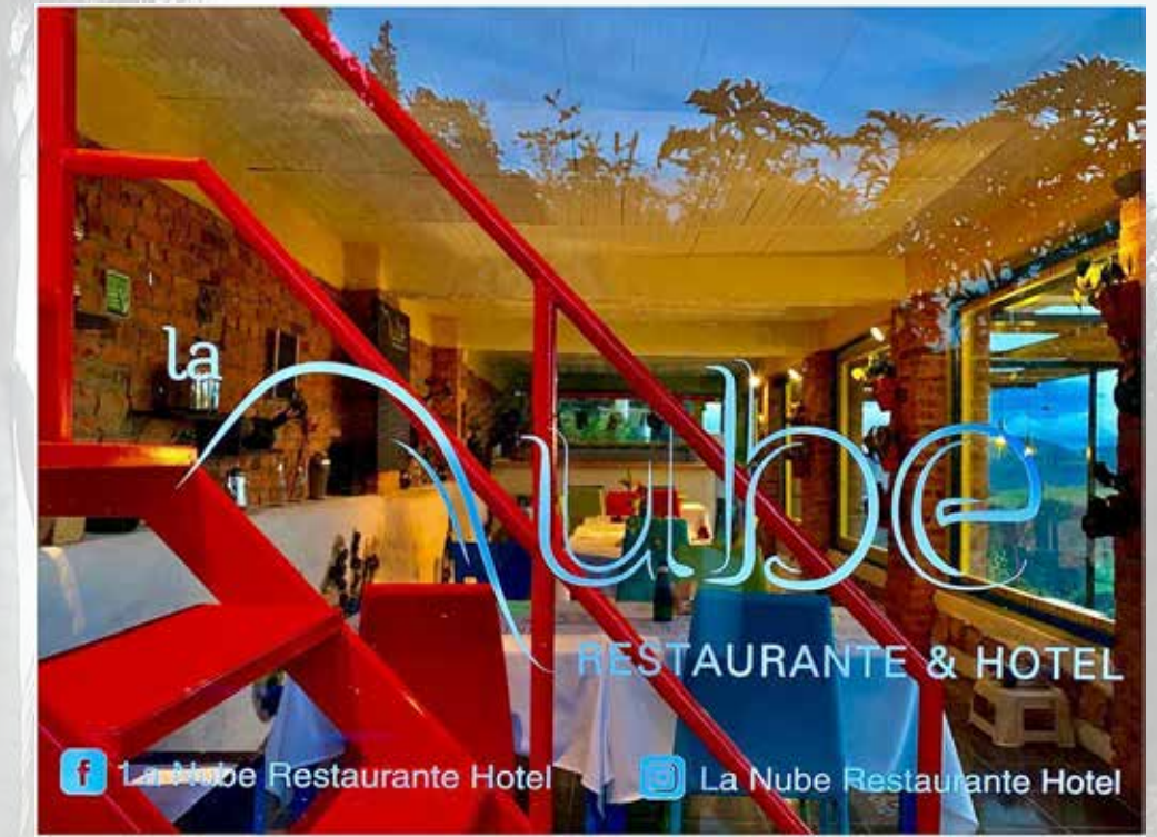
Restaurante La nube Vereda Astorga menú de degustación