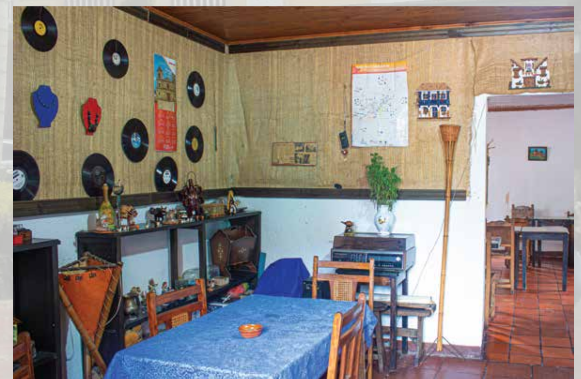
Restaurante Arte y Café calle 03 # 02-03

Horarios de atención: todos los días 12:00 m - 05:00 pm