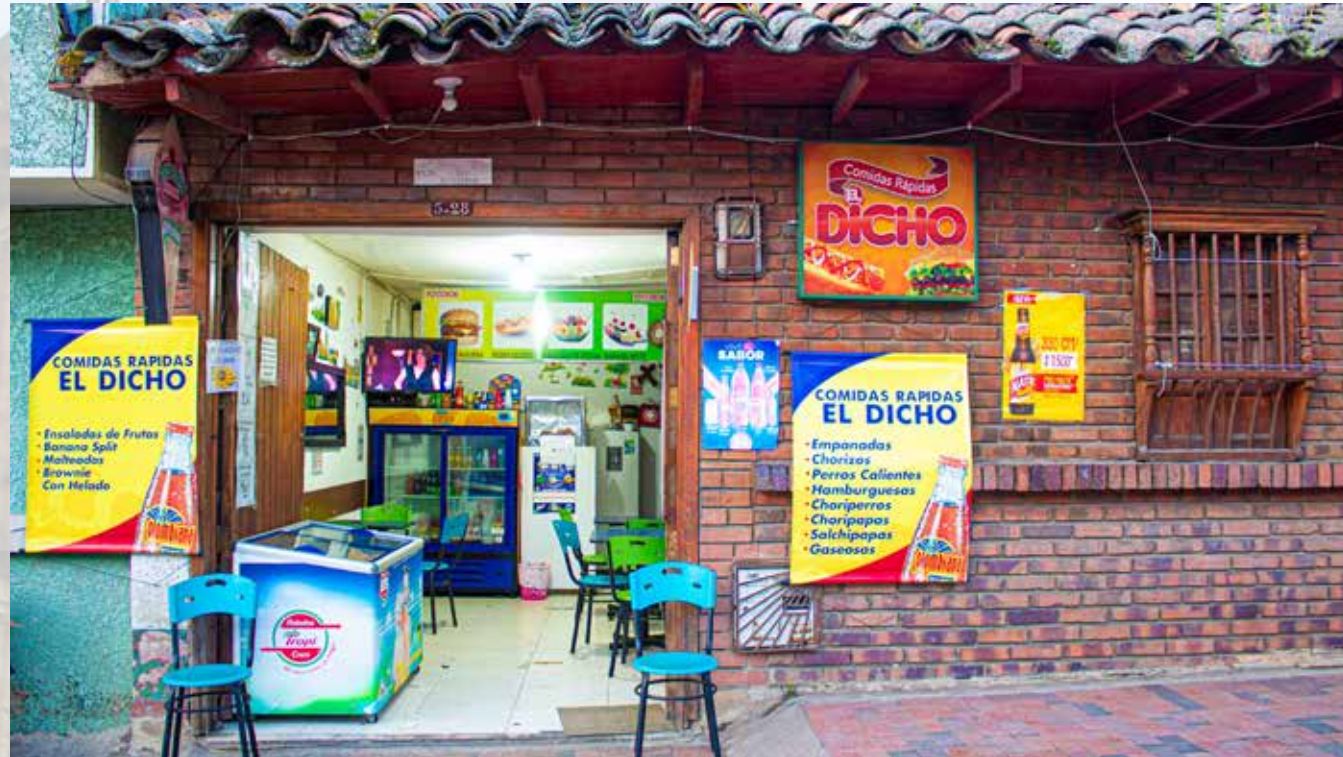
Comidas rapidas El Dicho