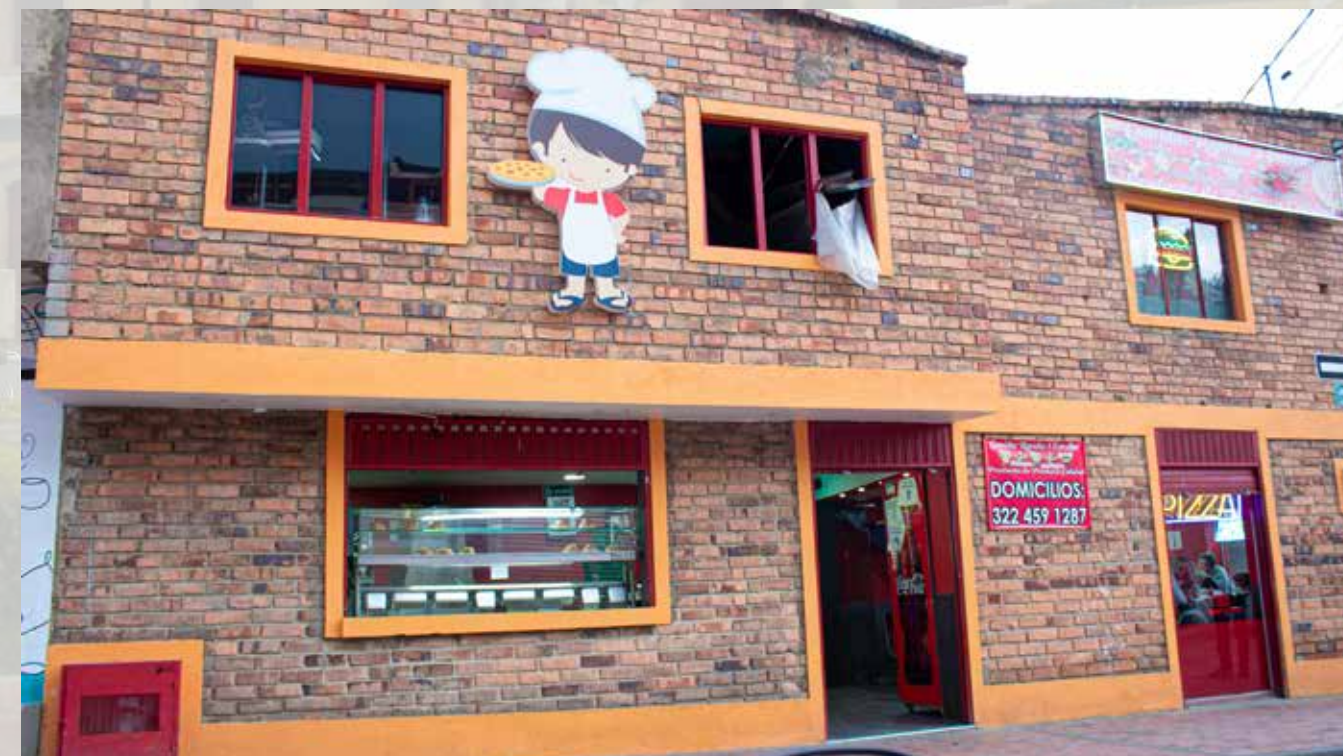
Comidas rapidas 5 estrellas