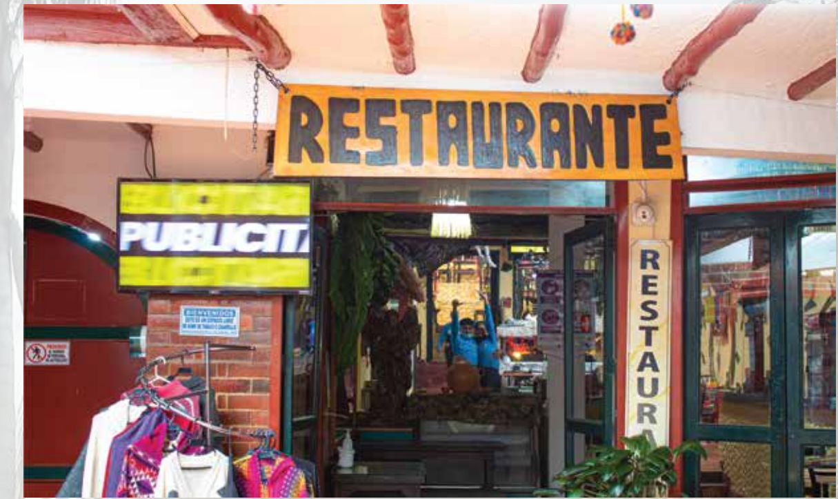
Restaurante Hornos de Sal Cl. 2 ## 0 - 90 Horarios de atención: sabados y domingos 12:00 m - 06:00 pm