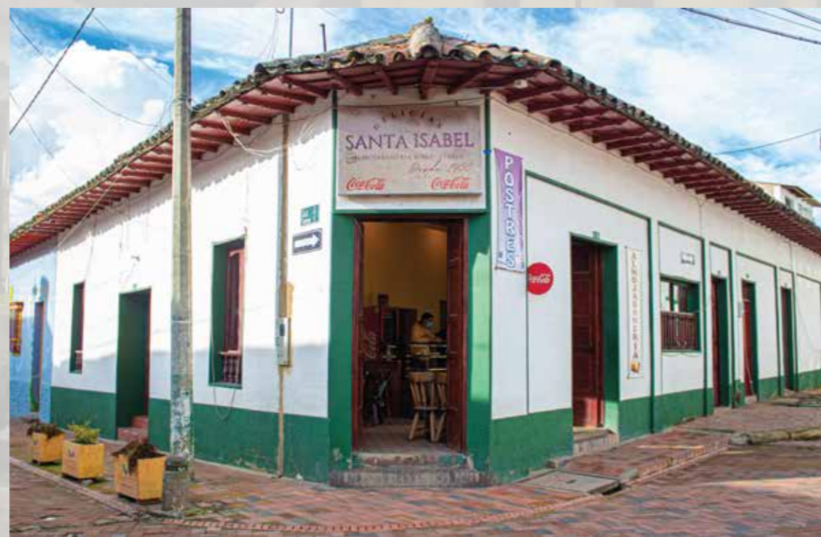
Almojabanería y Repostería Delicias Santa Isabel