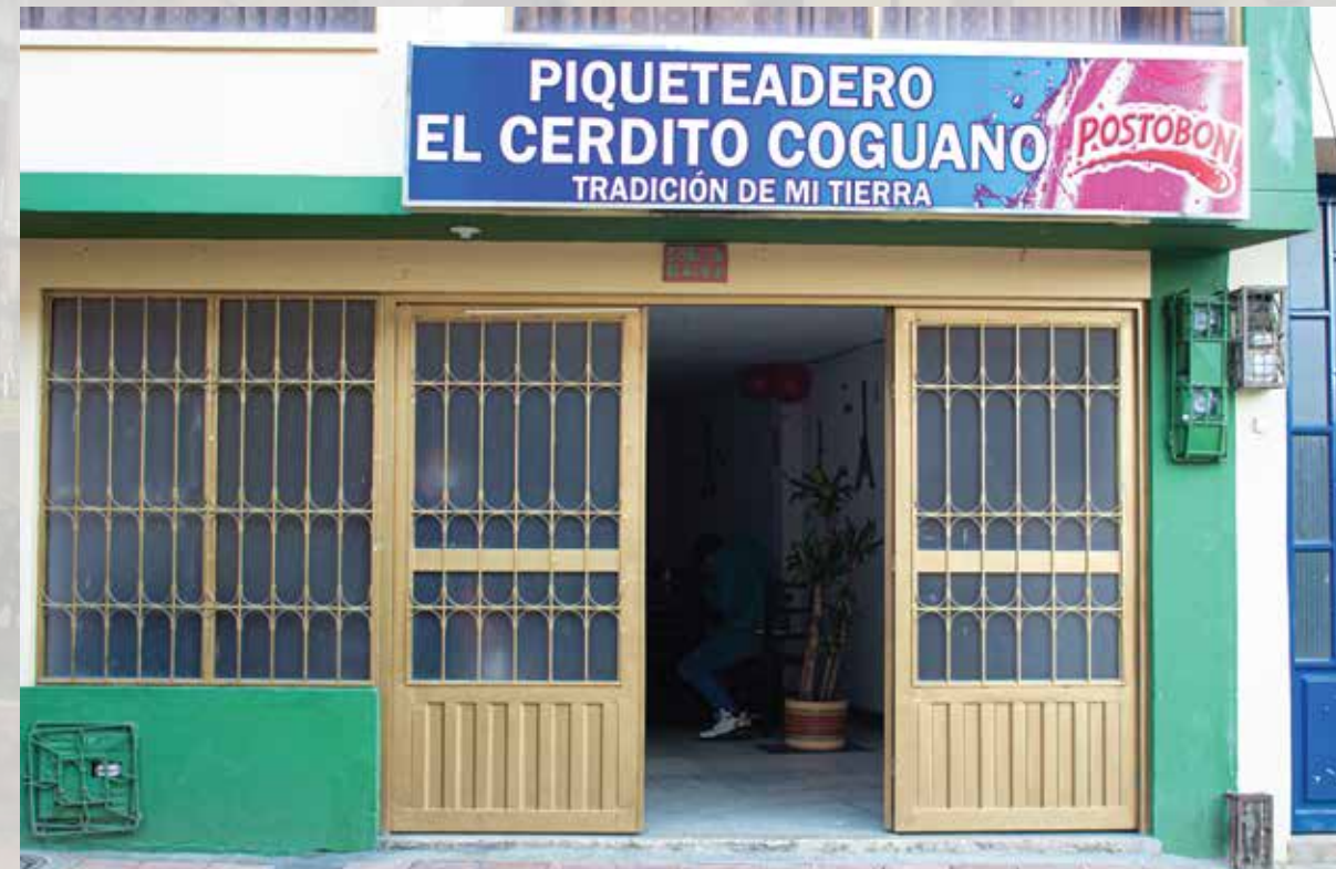
Piqueteadero El Cerdito Coguano Cl. 4 #4-75 Horarios de atención: sabados, domingos y festivos 12:00 m - 06:00 pm