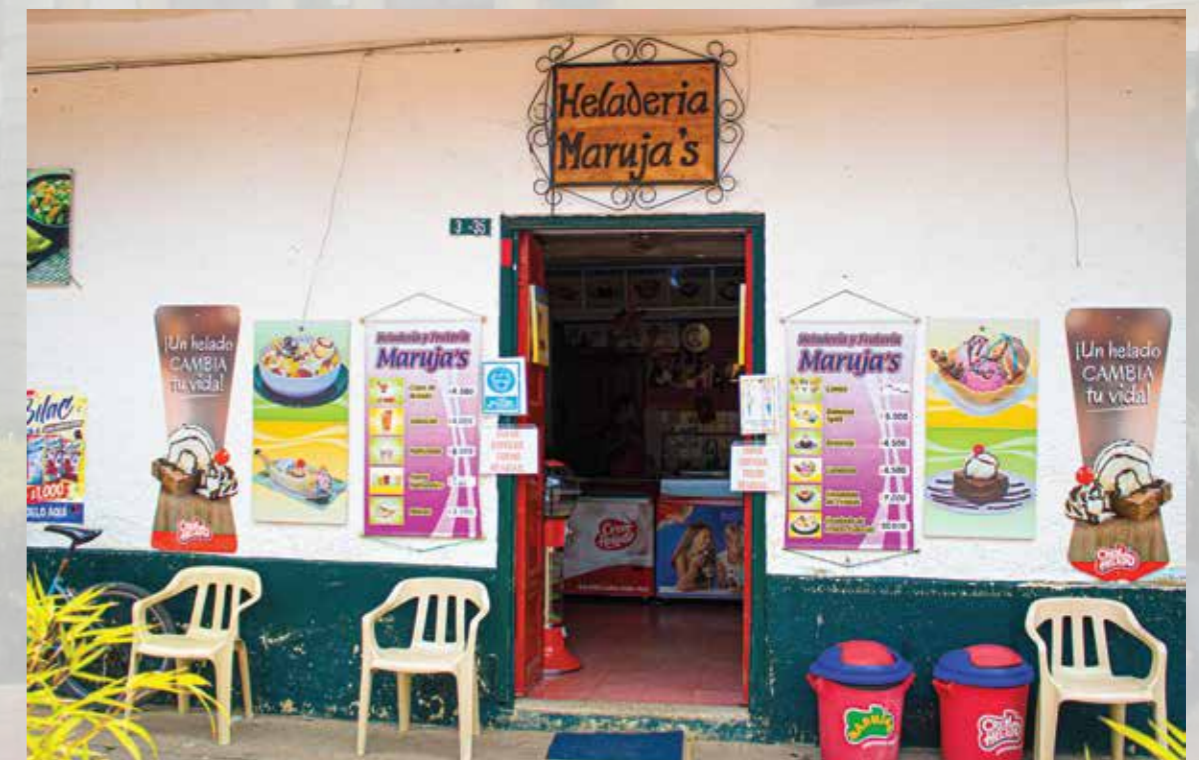
Heladeria de Frutería Marujas carrera 04 #03-55