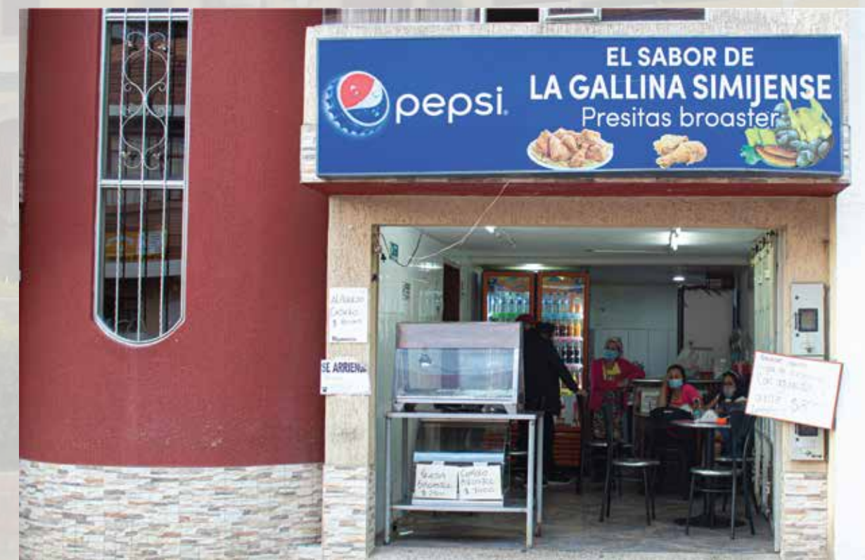
El sabor de la gallina simijense Presitas broaster Calle 03 # 04 -90 Horarios de atención: domingo a domingo