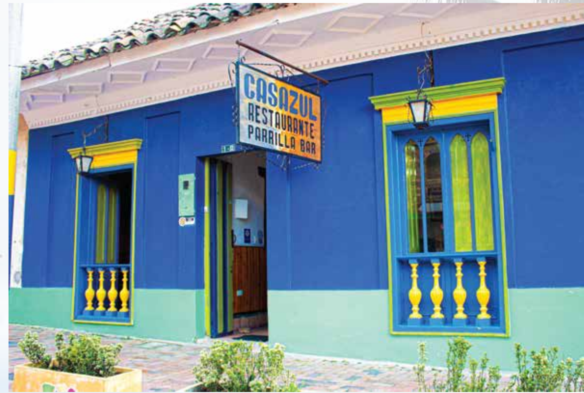
Restaurante manizagua - casa azul calle 2 # 01-33

Horarios de atención: sabados, domingos y festivos 11:30 am - 05:30 pm