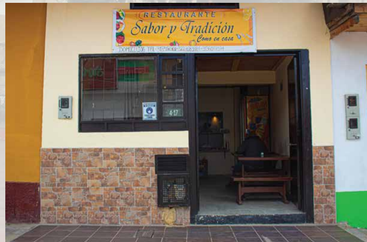
Restaurante bar Sabor y Tradición calle 02 # 04-17 Horarios de atención: todos los días 07:00 am - 09:00 pm