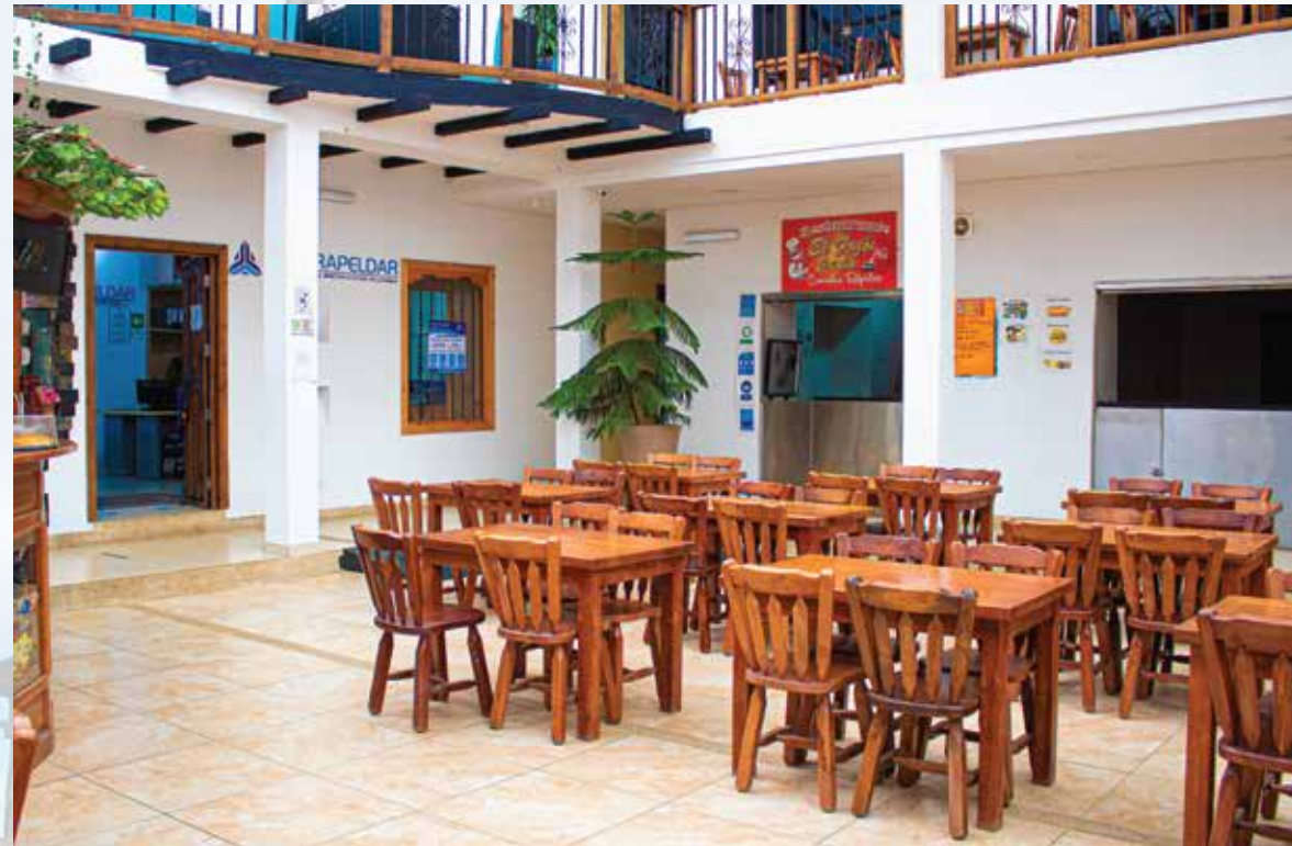
Restaurante Fogón Criollo calle 6 C.C La Virgen Horarios de atención: todos los días 06:30 am - 08:30 pm