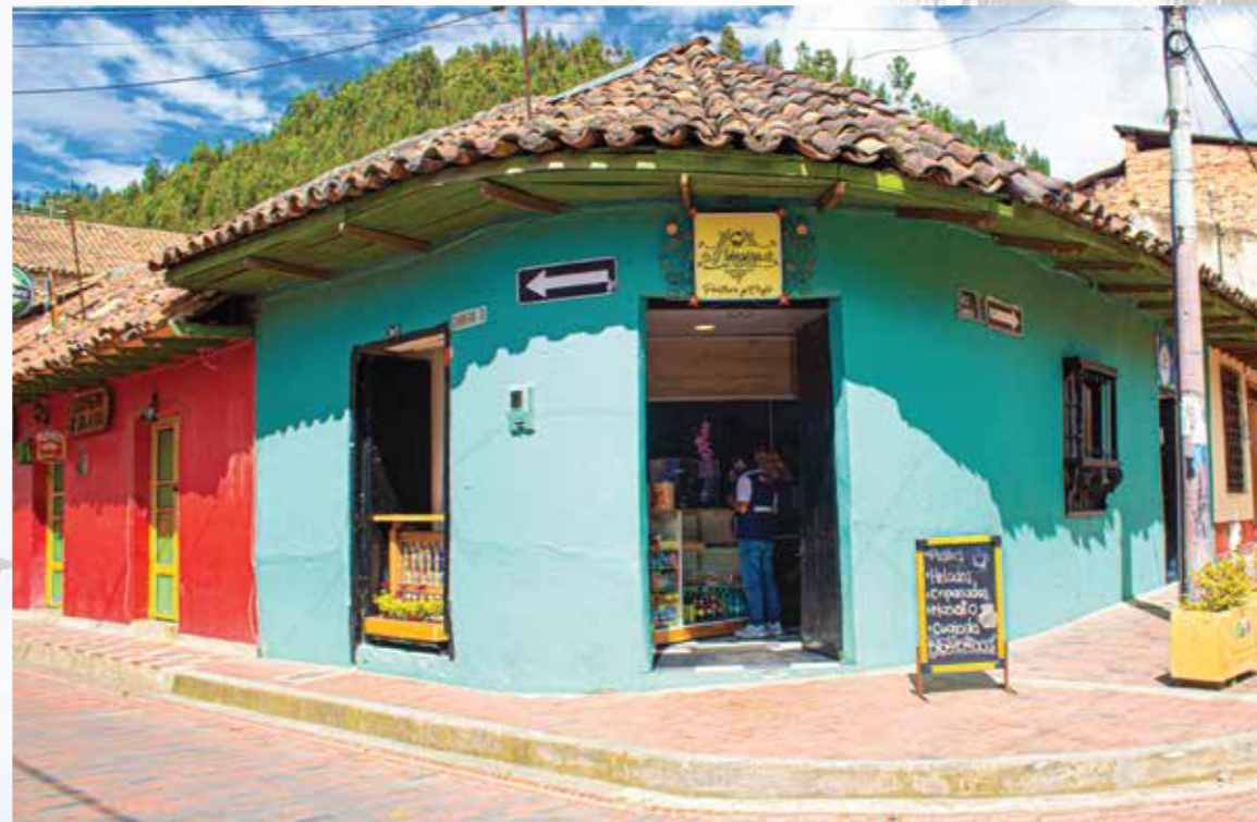
D'sobremesa Postres y Café Calle 03 # 02-29