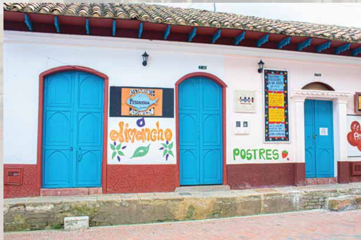
Restaurante Dimancho cra 3 # 2-28

Horarios de atención: todos los días 08: 00 am - 07:00 pm