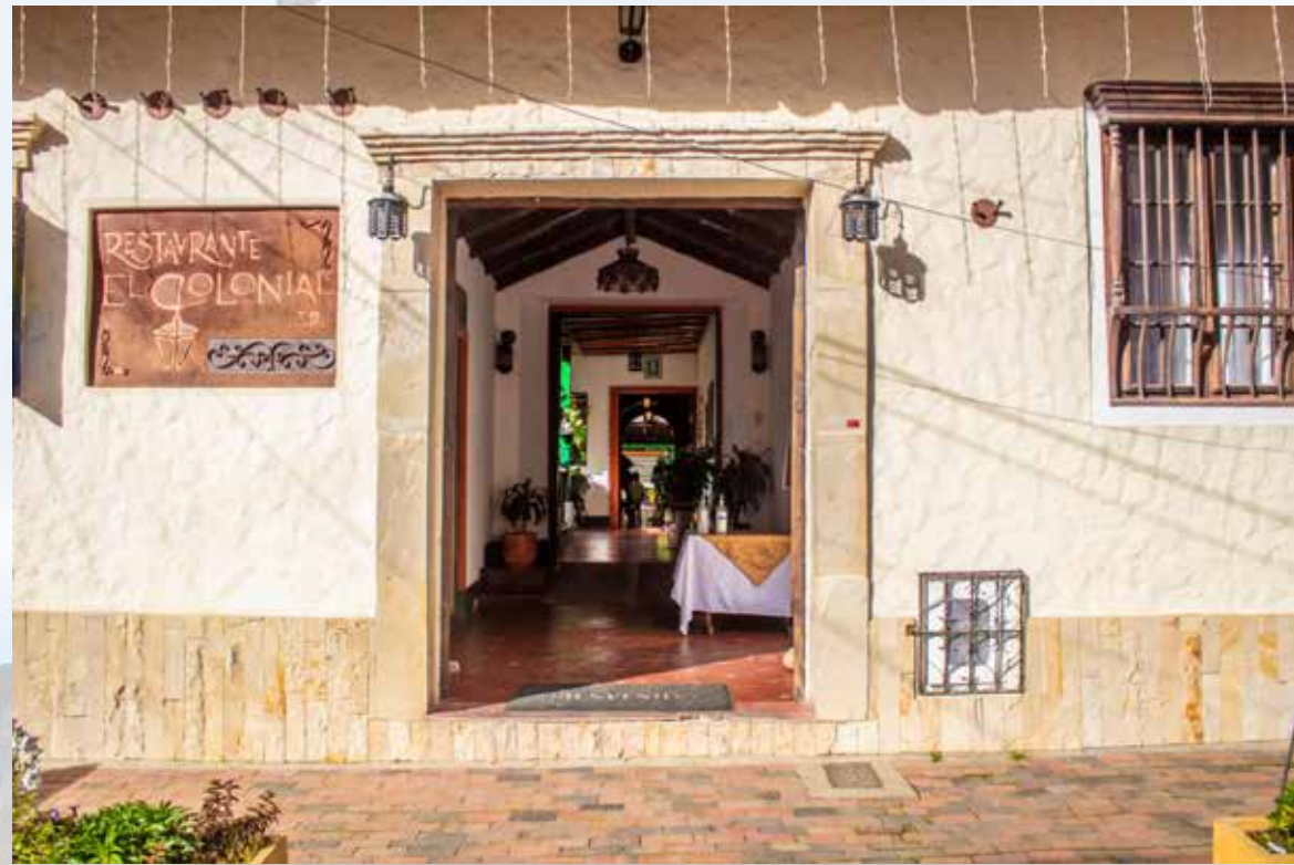
Restaurante El Colonial calle 4 # 5-26

Horarios de atención: sabados, domingos y festivos 11:30 am - 05:30 pm