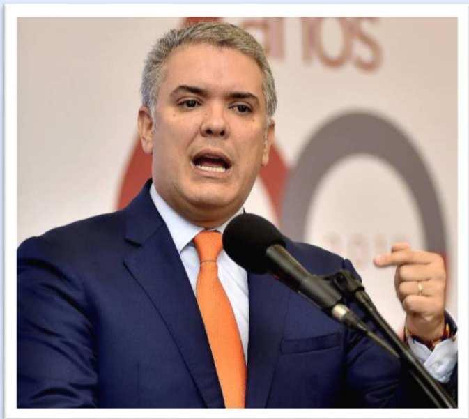
IVÁN DUQUE MÁRQUEZ Presidente de la República