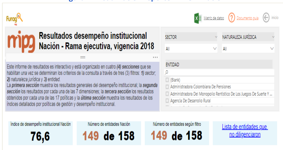
Figura 2. Visualización reporte MIPG – Nación

Las visualizaciones incluyen gráficos tipo radar, medidor, tacómetro, tornado y mapas coropléticos.