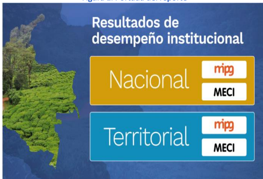
Figura 1. Portada del reporte