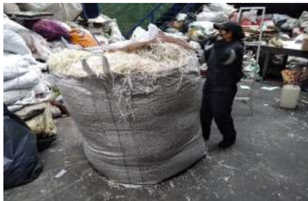
Proceso de llenado y consolidado de material destruido