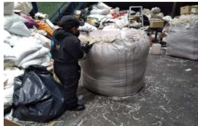
Proceso de llenado y consolidado de material destruido