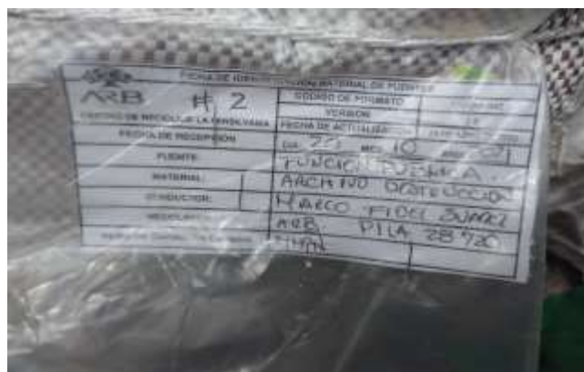
Embalado y rotulado de producto final para proceso de despacho y aprovechamiento final