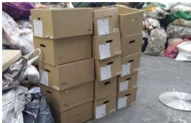
Separación y clasificación de material de archivo proveniente de la Entidad