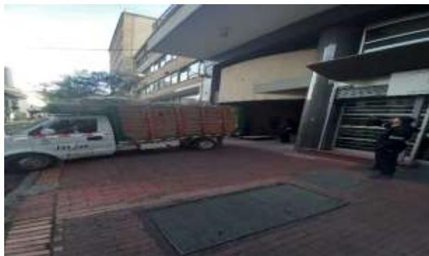
Salida del vehículo recolector hacia la bodega de aprovechamiento