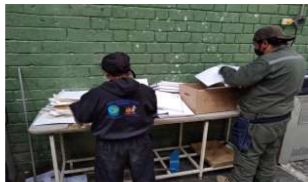
Separación y clasificación de material de archivo proveniente de la Entidad