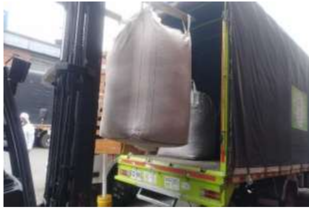
Actividad de entrega de material embalado para despacho y entrega a sitio de aprovechamiento