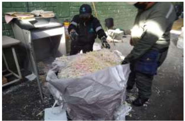
Salida del material destruido y recepción para acopio en bolsas tipo globo