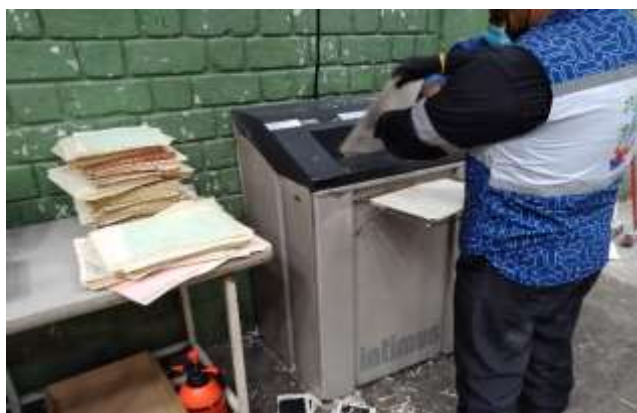
Actividad de destrucción mecánica del archivo de Función Pública