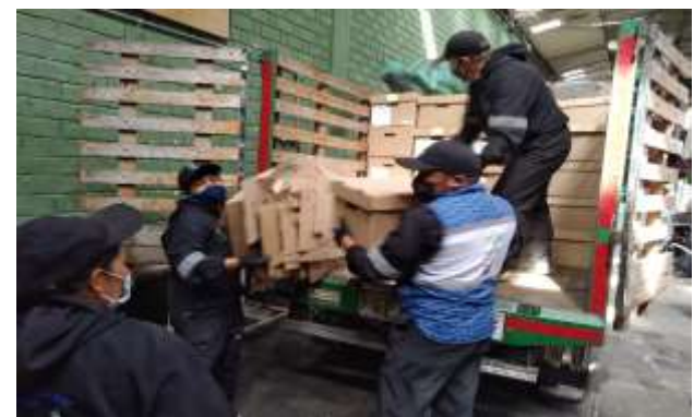
Descargue de archivo en bodega donde se efectuará la destrucción