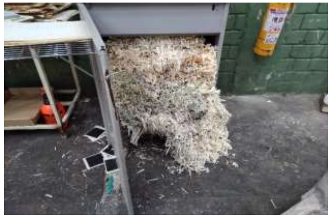
Salida del material destruido y recepción para acopio en bolsas tipo globo