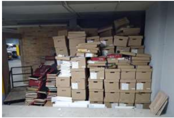
Acopio de archivo proveniente del área de Gestión Documental de la Entidad

A continuación, se anexa en registro fotográfico el desarrollo de la actividad mencionada en el marco del convenio número 211 de 2019, con el propósito de aunar esfuerzos entre Función Pública y la Asociación Cooperativa de Recicladores de Bogotá – ARB para la recolección, transporte y disposición final de los residuos aprovechables que genere la Entidad.