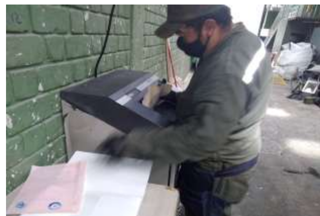
Actividad de destrucción mecánica del archivo de Función Pública