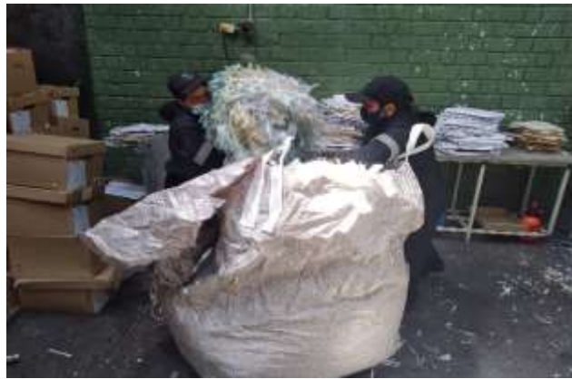
Salida del material destruido y recepción para acopio en bolsas tipo globo