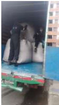
Actividad de entrega de material embalado para despacho y entrega a sitio de aprovechamiento