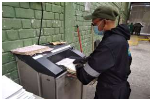
Actividad de destrucción mecánica del archivo de Función Pública