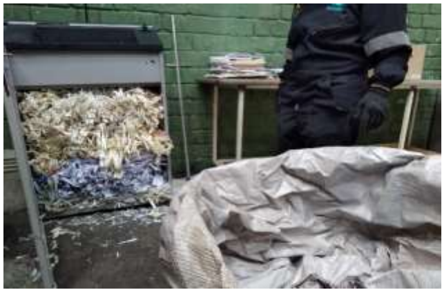
Salida del material destruido y recepción para acopio en bolsas tipo globo