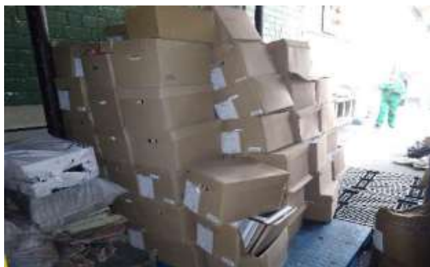
Acopio de archivo en bodega para proceso de separación, clasificación y destrucción