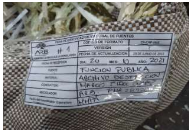
Embalado y rotulado de producto final para proceso de despacho y aprovechamiento final