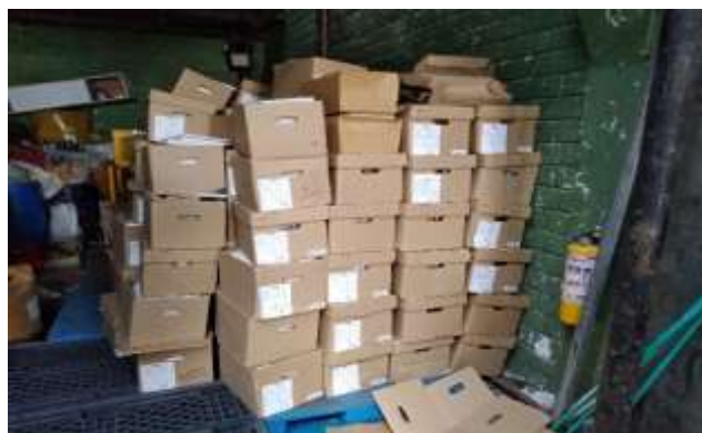
Acopio de archivo en bodega para proceso de separación, clasificación y destrucción