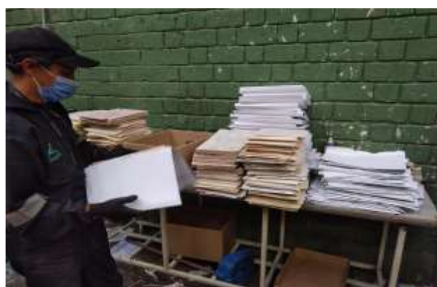
Separación y clasificación de material de archivo proveniente de la Entidad