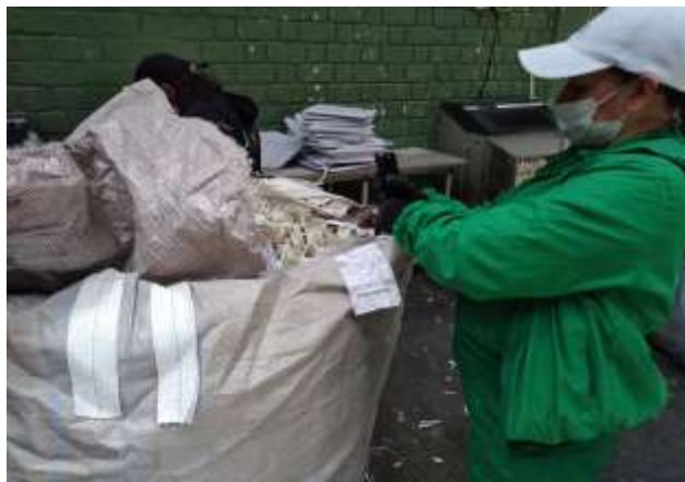
Embalado y rotulado de producto final para proceso de despacho y aprovechamiento final