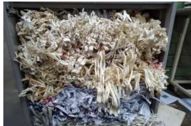
Condiciones finales del material de archivo sometido a proceso de destrucción mecánica