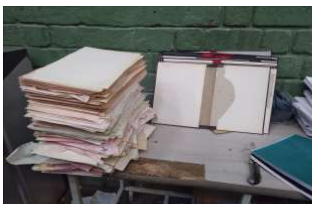
Separación y clasificación de material de archivo proveniente de la Entidad