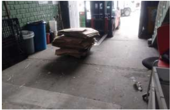
Registro del pesaje del material seleccionado