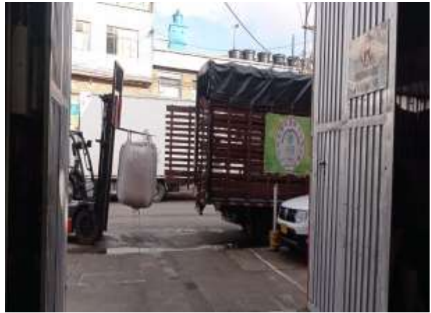
Actividad de entrega de material embalado para despacho y entrega a sitio de aprovechamiento