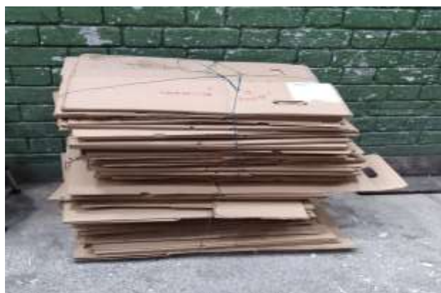
Separación y clasificación de material de archivo proveniente de la Entidad