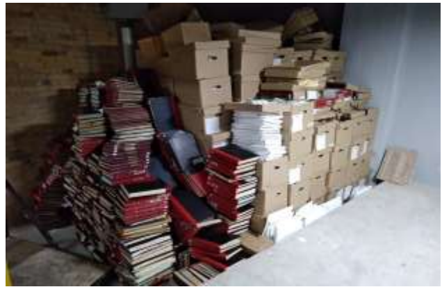
Acopio de archivo proveniente del área de Gestión Documental de la Entidad