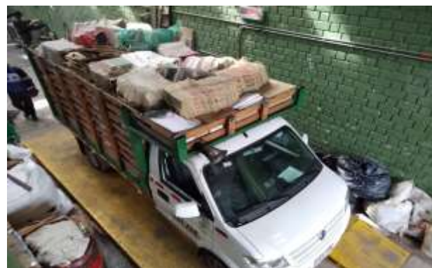
Pesaje del vehículo con material de archivo en báscula de la bodega