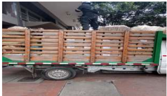
Salida del vehículo recolector hacia la bodega de aprovechamiento