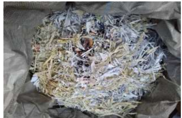
Condiciones finales del material de archivo sometido a proceso de destrucción mecánica