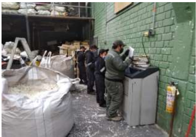
Panorámica proceso de destrucción y embalado en bolsas tipo globo