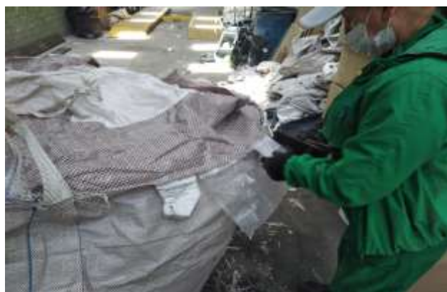
Embalado y rotulado de producto final para proceso de despacho y aprovechamiento final