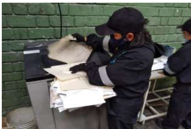
Actividad de destrucción mecánica del archivo de Función Pública