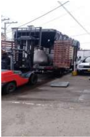
Actividad de entrega de material embalado para despacho y entrega a sitio de aprovechamiento