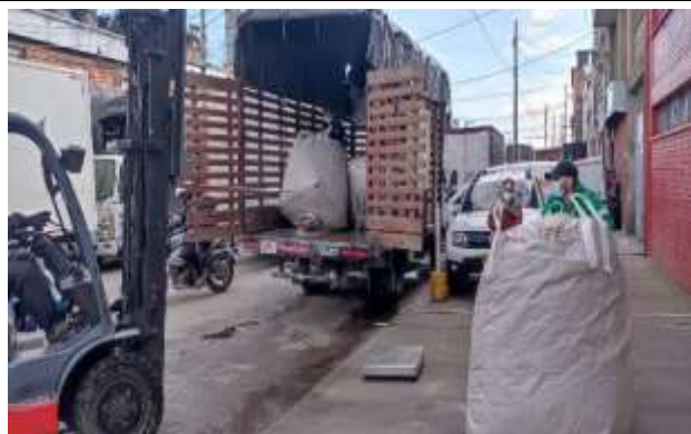
Izaje del material con ayuda mecánica para ubicación en báscula de pesaje