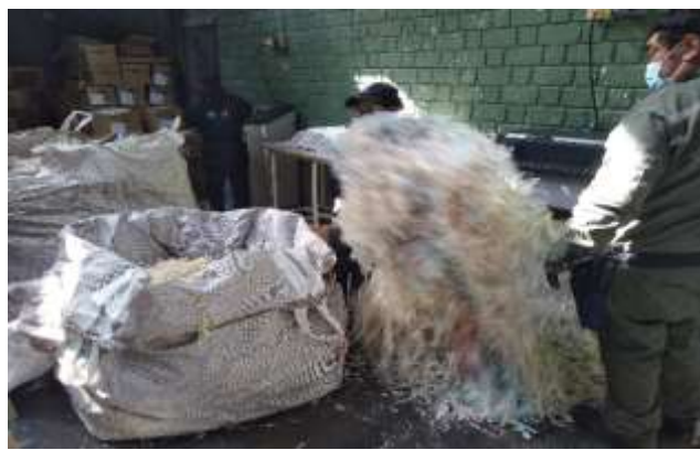
Proceso de acopio en globos y acomodación de material