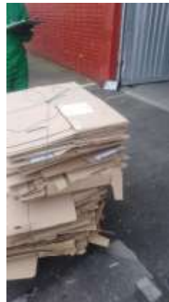
Registro del pesaje del material seleccionado