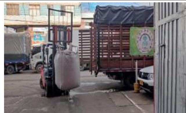
Izaje del material con ayuda mecánica para ubicación en báscula de pesaje