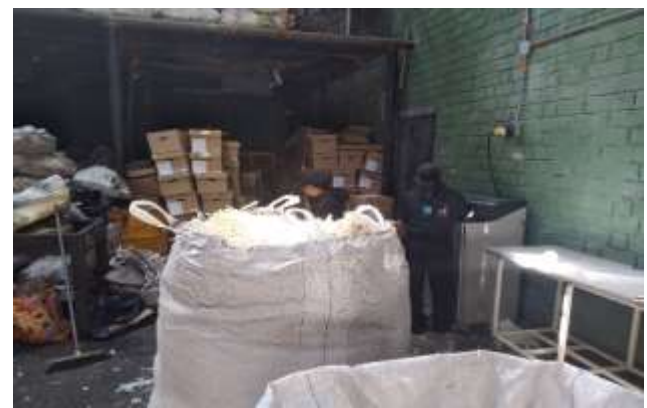
Proceso de acopio en globos y acomodación de material