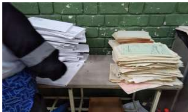
Separación y clasificación de material de archivo proveniente de la Entidad