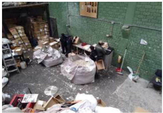
Panorámica proceso de destrucción y embalado en bolsas tipo globo